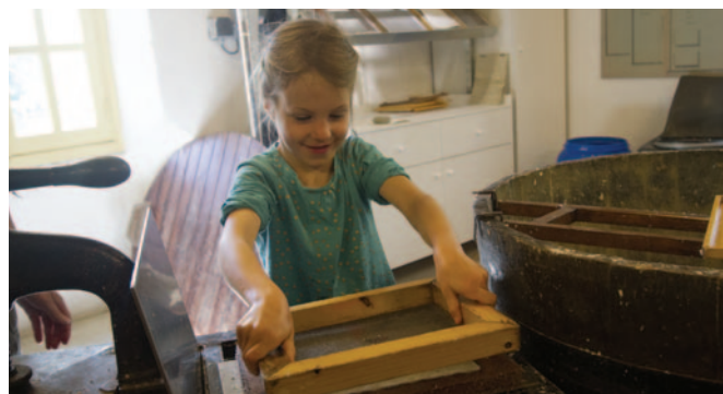
Au moulin du Liveau à Gorges (Loire-Atlantique), comme dans plusieurs autres, la jeune génération est initiée à l'art de la fabrication du papier en apprenant les gestes traditionnels.